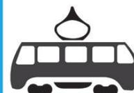
Автобус, троллейбус, трамвай