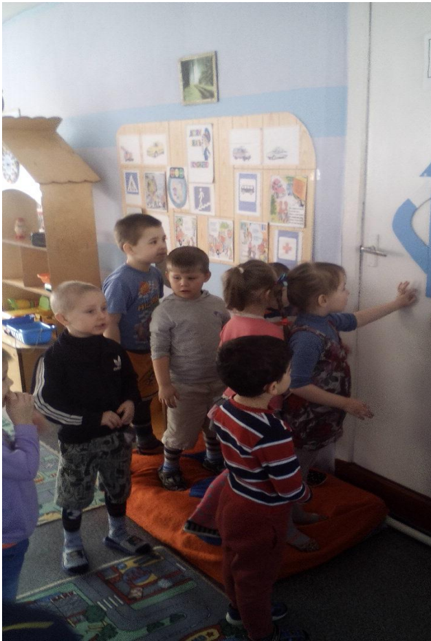
Ребята рассказывают о правилах пешеходного перехода.